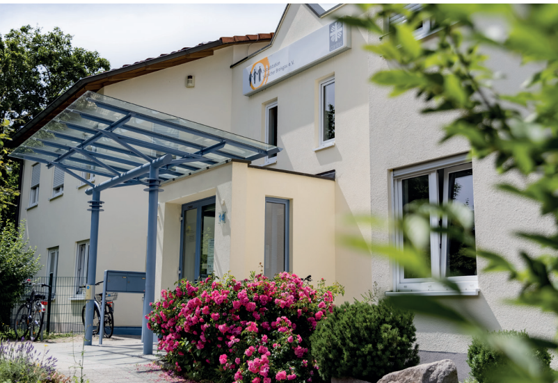
// Mitten im Wohngebiet, umgeben von einem Garten, liegt die Sozialstation Südlicher Breisgau e. V.